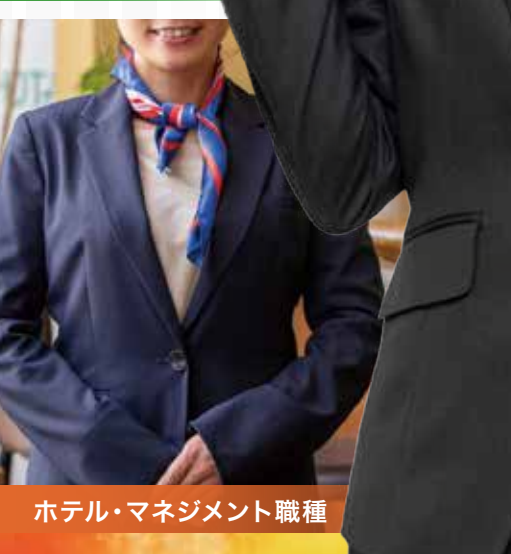
ホテル・マネジメント職種