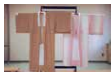
和服製作作業の作品例