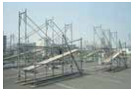
とび作業の作品例