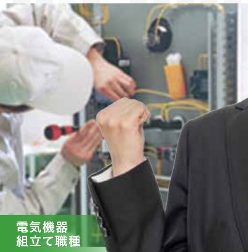
電気機器 組立て職種