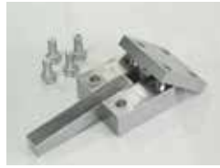
機械組立仕上げ作業の作品例